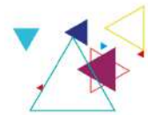
Fig1 Démarche de diagnostic territorial de santé